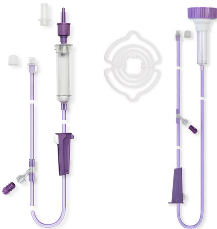
Flocare® Pack set Gravity™

for tilkobling af både Nutricias og andre leverandørers sondeernæring i plastic- og glasflaske.